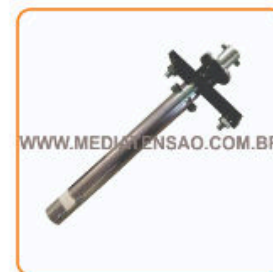
Comando / Punho de manobra rotativo (Cubículo Blindado)