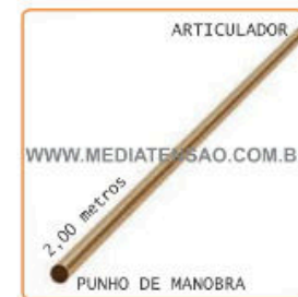
Tubo de Descida para Seccionadora - Interligação ao punho de manobra