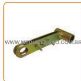
Alavanca para abertura por vara de manobra