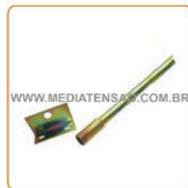
Prolongador com Mancal Curto