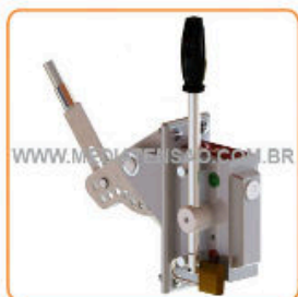
Punho de Manobra com Bloqueio tipo Kirk Cadeado