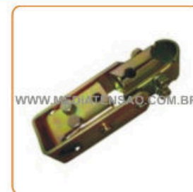
Articulador para abertura por punho de manobra