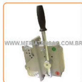
Punho de Manobra Simples