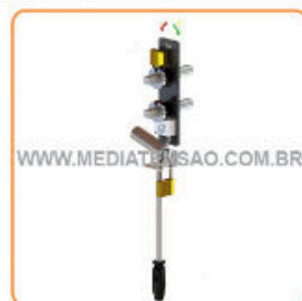
Comando Rotativo Duplo (Cubículo Blindado)