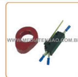
Contato Auxiliar para Intertravamento Elétrico 1NA + 1NF