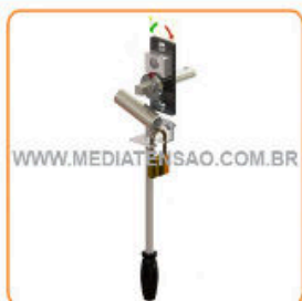
Comando Rotativo (Cubículo Blindado)

HOME / / 06-CHAVES SECCIONADORAS / ACESSÓRIOS PARA CHAVE SECCIONADORA