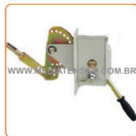
Punho de Manobra com Bloqueio tipo Kirk Yale