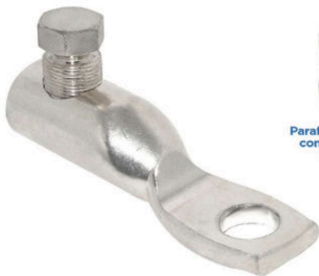
Parafuso torquimétrico com ponta giratória de aço inox.