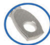
COM FRISOS Facilitam e melhoram o contato elétrico.

Fabricados com um ou dois parafusos de fixação e olhal com um ou dois furos.